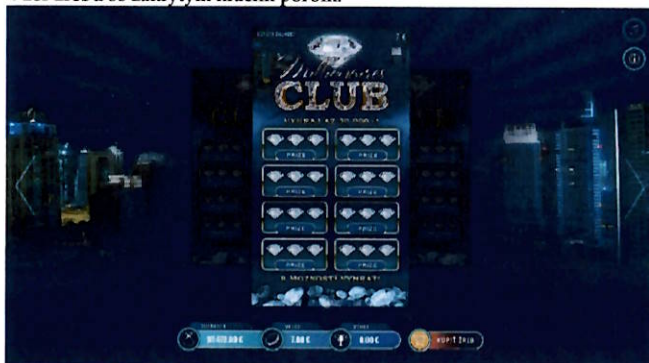
Vzor žrebu so zakrytým hracím poľom: