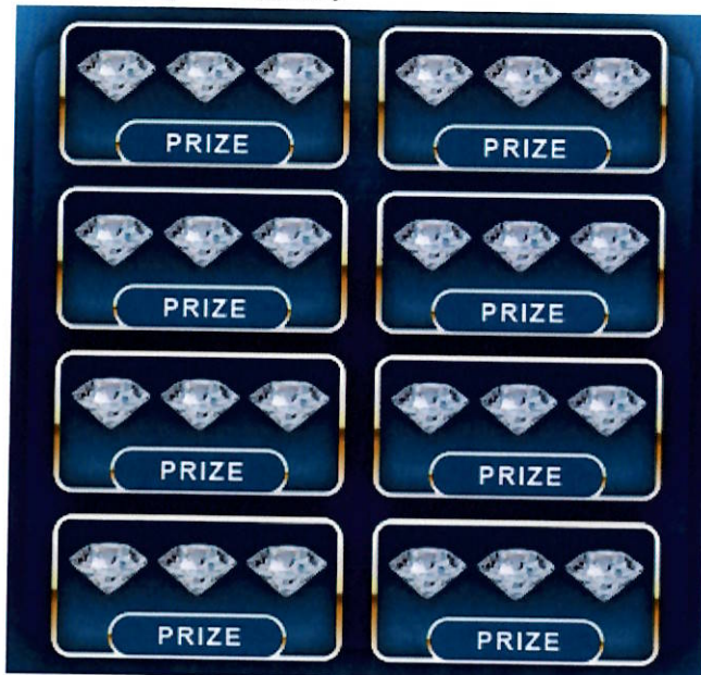
Detail zakrytej stieracej plochy